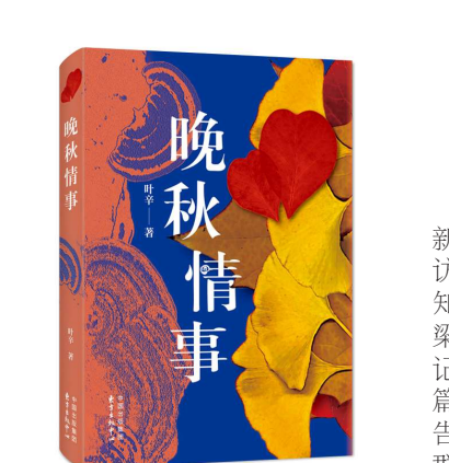
《晚秋情事》 叶辛 著 东方出版中心2023年1月出版

她亲近,越觉得她全部的美、生气、灵魂都聚集而涌现在面庞之上、眉目之间。其神妙之处,竟把世上的美融汇而贯通在这里面了。”我想等我有空时,也许会为他写一篇长文。